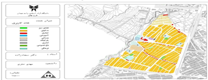
نقشه شماره 1: کاربری اراضی

محله منوچهری به مساحت تقریبی 40 هکتار و با جمعیتی بالغ بر 12940 نفر در غرب بلوار دانشگاه و جنوب محور همدان - کرمانشاه قرار دارد. این محله از سویی با بلوار دانشگاه، از سمت شمال بوسیله محور همدان - کرمانشاه، از سمت جنوب بوسیله بافت ساخته شده از طرف غرب بوسیله مسیل و سپس کاربری خدمات درمانی محدود شده است. این محله تنها در بخش های محدودی از شمال و شمال شرقی امکان توسعه داشته که در طرح تفصیلی این محدوده به کاربری های خدماتی همچون آموزشی، ورزشی و فضای سبز اختصاص پیدا کرده است.