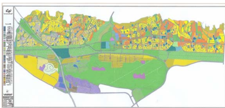
شکل ۲- کاربری اراضی شهر جدید صدرا