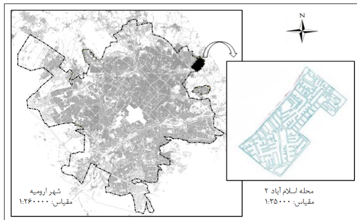
شکل ۱- موقعیت محدوده مورد مطالعه در شهر ارومیه

ساکنان این محدوده مهاجرین وارد شده از دیگر نقاط استان به ویژه روستاها و شهرهای شمالی استان (ماکو، پلدشت و ...) هستند. اگر چه در طی سال‌های اخیر جابه‌جایی‌های گسترده‌ای نیز در سطح محدوده رخ داده و افرادی که در دیگر نقاط شهر سکونت داشتند به آن وارد شده‌اند؛ با این حال محدوده مورد بررسی از یکپارچگی فرهنگی و قومی برخوردار است.