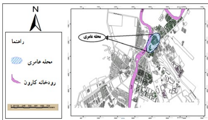
شکل ۱: موقعیت محله عامری در شهرا اهواز

محله عامری (محله ۱۰) در تقسیمات جغرافیایی اهواز در شمال شرقی در منطقه ۳ قرار دارد. این محله از شمال به محله خرم کوشک، از شرق به محله سخیره، از غرب به رودخانه کارون، از جنوب به باغات محدود می‌گردد. محله عامری در شرق شمال شرقی اهواز قرار گرفته و این محله از نظر قرارگیری کاملاً مقابل منطقه کیانپارس قرارداد. ساختار کلی این محله به سه بخش کاملاً متمایز تقسیم می‌شود: الف - لایه حاشیه ای خیابانهای اصلی (کاربری تجاری - خدماتی) ب - لایه های درونی (کاربری مسکونی) و ج - مجموعه فرهنگی - مذهبی (حرم مطهر علی بن مهزیار) با توجه به انواع بافت ها، این محله جزء بافت تاریخی (هسته اولیه) می باشد. تراکم ناخالص آن ۲۶۰ /۸۶ نفر در هکتار و تراکم خالص آن ۴۲۳ نفر در هکتار می باشد. که این افزایش جمعیت ناشی از فرسوده بودن بافت و پایین بودن قیمت زمین و اجاره و موقعیت پذیرش مهاجران روستایی در این محله می باشد. شکل ۱ موقعیت محله عامری در شهر اهواز را نشان می دهد.