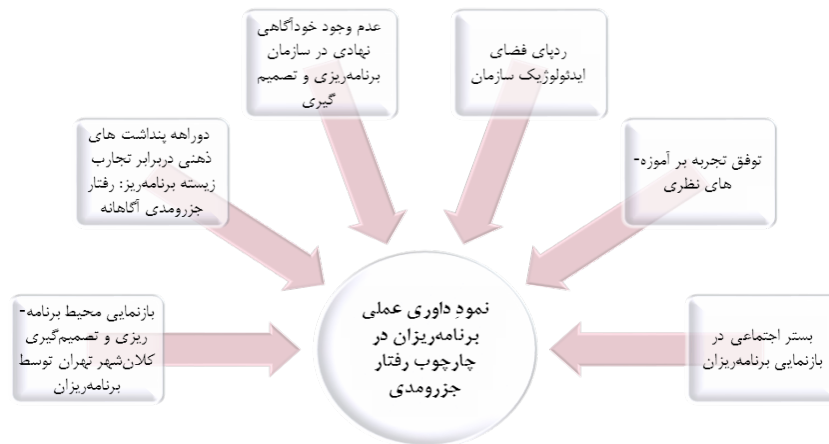
شکل (۳). مقولهٔ مرکزی بر ساخت‌شده از زیرمقوله‌ها