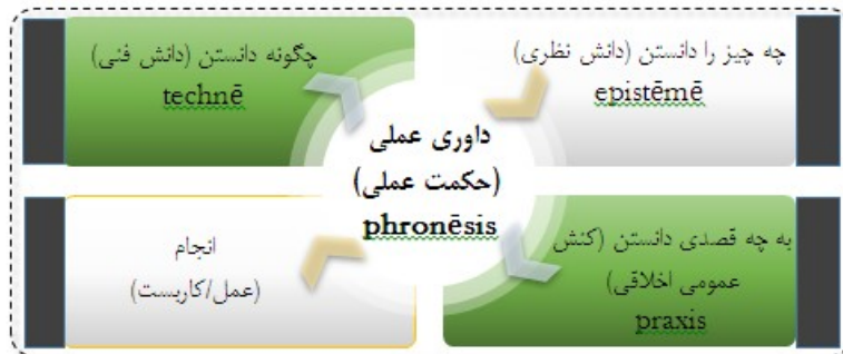
شکل (۱). برنامه‌ریزی به‌مثابهٔ کاربست دانستن