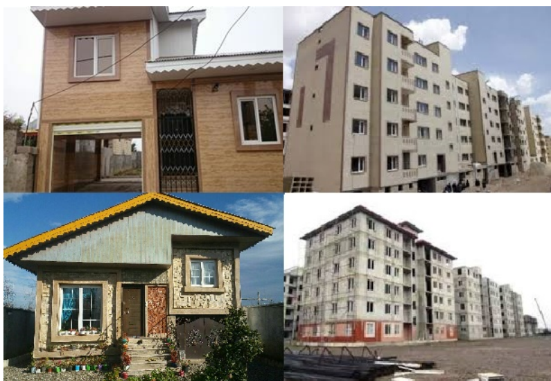
شکل ۳ تصاویری از مسکن بر اساس طراحی شخصی و دولتی در شهرستان‌های مورد مطالعه‌ی استان گیلان

باتوجه به میزان آماره F با رقم ۳۵/۴۲۲ و سطح معناداری ۰/۹۹ ، نتایج حاصله حاکی از آن است که تفاوت معناداری میان شاخص‌های منتخب در پژوهش حاضر وجود دارد. بنابراین چنین استنباط می‌شود که حداقل یک زوج از طبقه‌ها با هم اختلاف دارند. حال برای مشخص نمودن این‌که کدام یک از این زوج‌ها با هم متفاوتند، می‌باید از آزمون‌های ویژه‌ی موسوم به آزمون‌های پس از تجربه استفاده نمود. از طرفی به دلیل اهمیت و کثرت شاخص‌های منتخب از آزمون تعقیبی TUKEY، استفاده شده است (جدول ۱)