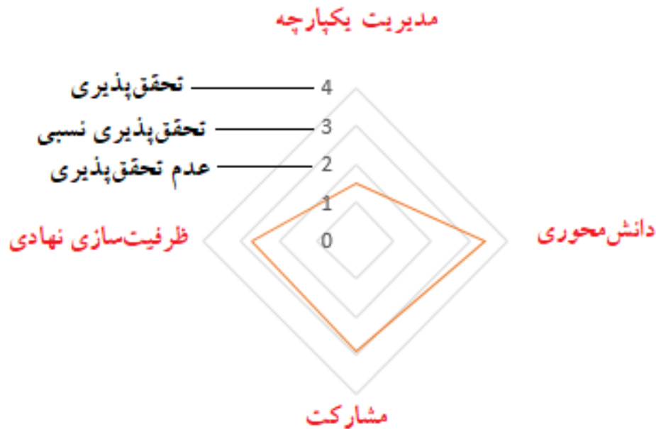
شکل ۳ نمودار راداری سطح تحقق‌پذیری مؤلفه‌های اصلی نظام برنامه‌ریزی و مدیریت یکپارچه‌ی بازآفرینی (ترسیم نگارندگان)

تاریخی) استفاده شده است. در تحلیل عاملی کیو برخلاف تحلیل عاملی افراد به جای متغیرها دسته‌بندی می‌شوند.