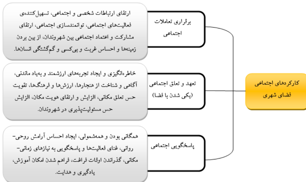
شکل ۱ مدل مفهومی تحقیق (مطلوبیت کارکردهای اجتماعی فضای شهری)

پژوهش به صورت موردی در مرکز شهر مکزیکوسیتی انجام شده و قوانین و مقررات تعیین‌شده توسط دولت مکزیکوسیتی که استفاده از خیابان را تنظیم می‌کند، مورد بررسی قرار داده است. نتایج پژوهش نشان می‌دهد که بین عدم وضوح در قانون مربوط به فعالیت‌ها و عملکردهای احتمالی در خیابان و یک اجماع ظاهراً ضمنی بین شهروندان در مورد چگونگی مناسب بودن چنین فضاهای عمومی، اختلاف نظر وجود دارد. این تضاد در کارکردهای فضاهای عمومی به شیوه‌های سنتی و جدید مشهود می‌باشد. کائو و کانگ ۱ (۲۰۱۹)، در تحقیق خود روابط اجتماعی و الگوهای استفاده‌شده در فضاهای عمومی شهری در چین و انگلستان را مورد مطالعه قرار داده‌اند. این تحقیق سه نوع روابط اجتماعی را در فضاهای عمومی تعریف می‌کند: جفت صمیمی، گروه صمیمی و گروه اجتماعی. جفت‌های صمیمی و گروه‌های صمیمی در موارد زیاد در حال صحبت و نشستن و استفاده از امکانات