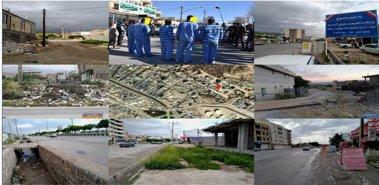
شکل ۲: نمایی از وضعیت بافت کالبدی و اجتماعی محله بنسجان